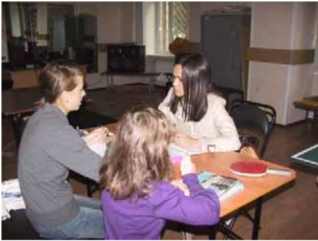
Si ripassano le lezioni

In Milia ed in qualche volontario, i ragazzi trovano questo sostegno, oltre che una “sorella maggiore”.