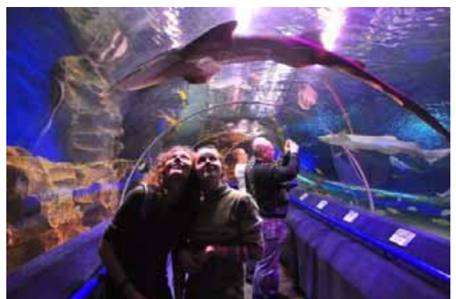
Sotto lo squalo