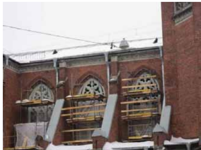
I finestroni gotici

Ai tempi sovietici, i finestroni erano stati tagliati e dimezzati in forme rettangolari per tutto il perimetro della chiesa ed ora, riacquistate le misure e le forme originarie, essi fanno proprio una gran bella figura: e tutti i passanti, appena li scorgono, si fermano ad ammirarli con il naso all'insù.