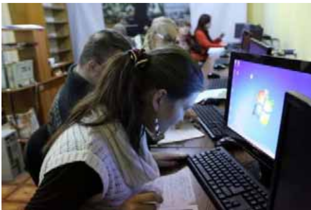
I nostri ragazzi al corso di informatica

E così ... il tredici di febbraio ha preso avvio un “Corso di informatica” di primo livello!