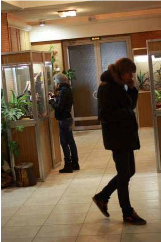
In visita al “Terrario”

Il giorno ventidue febbraio è stato, invece, quello della visita alla zoo cittadino.