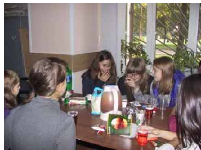
Momenti di amicizia al “Doposcuola”

Fanno anche amicizia tra loro, i ragazzi, al “Doposcuola”: si intende!