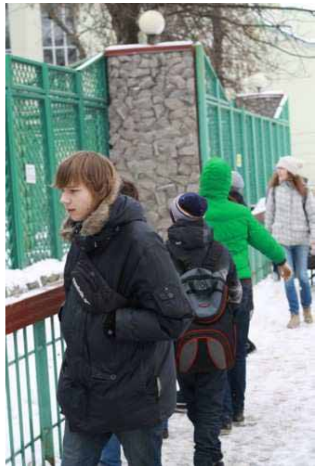
Tra le gabbie allo zoo

I vincitori di concorsi e tornei, sono stati ovviamente premiati assieme a coloro che si sono piazzati nelle prime posizioni.