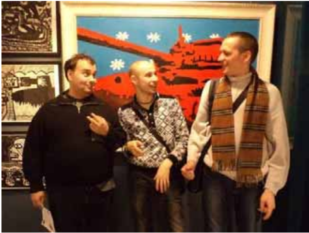
Alcuni ragazzi dello “Spazio della gioia” alla “Galleria d'arte contemporanea”