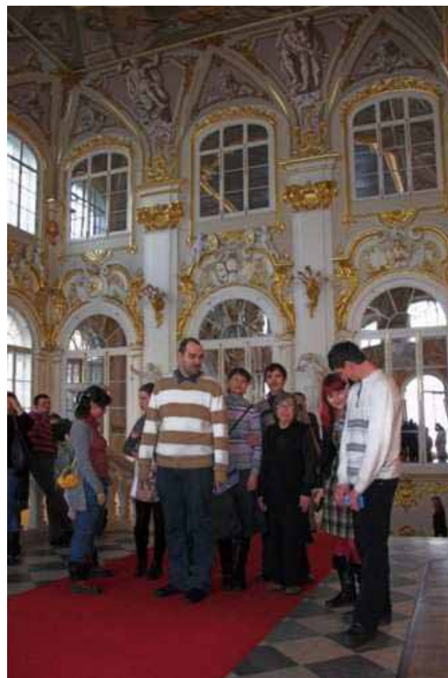
I ragazzi dello "Spazio della gioia" all'Ermitage