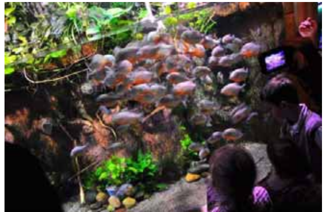
Pesci ... di tutti i colori!

Insomma: non può non colpire un incontro, a tu per tu, con uno squalo che volteggi sopra la tua testa, mentre tu passeggi in un tunnel che si snoda ... in mezzo alle acque e sul fondale!