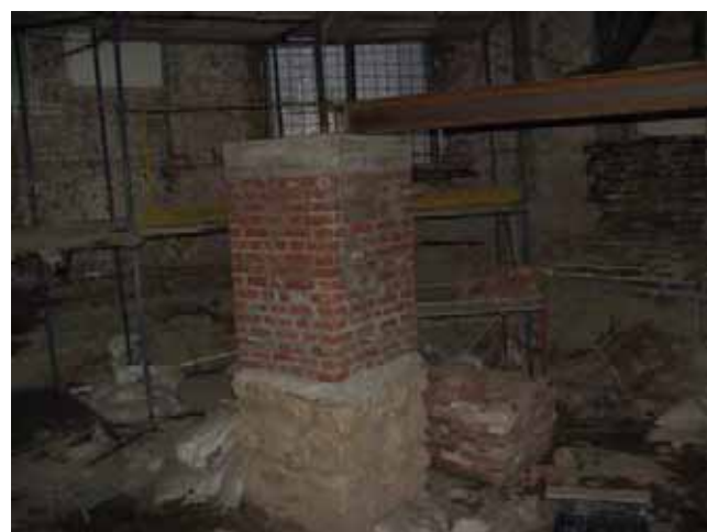
I lavori all'interno