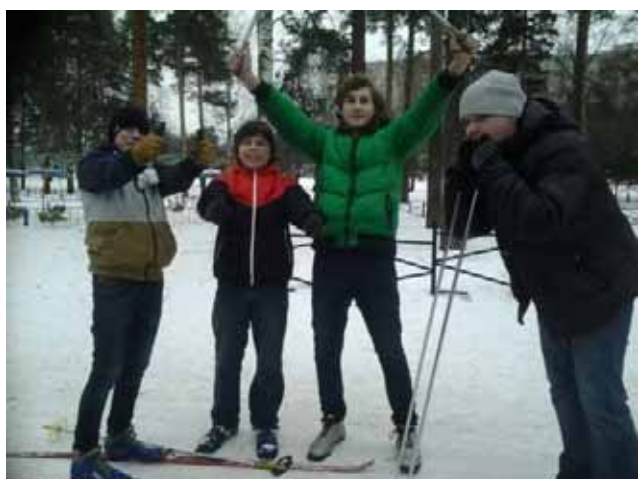
Momenti della giornata sulla neve