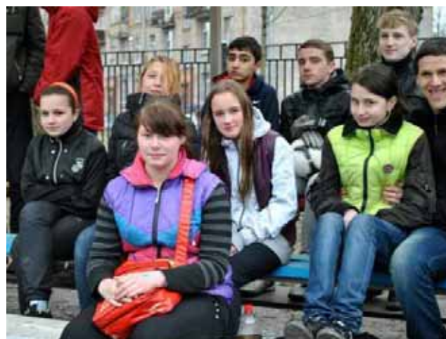
Il supporto delle ragazze sugli spalti

E sperando anche in un migliore tempo atmosferico e una temperatura più tiepida ... non ci resta che augurare: vinca il migliore!