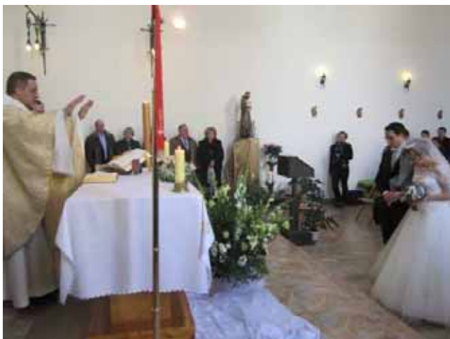
La benedizione degli sposi presso la cappella di Sant'Antonio

La nostra parrocchia, piccola famiglia, si è così stretta attorno ai novelli sposi ed ha pregato e festeggiato con loro e con i loro parenti.