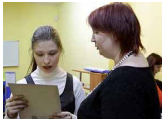
La consegna dei "certificati"