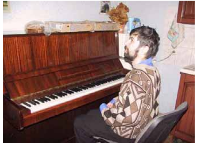
A. al “Centro diurno”

Ma molto tempo A. lo passa anche con Masha. Ci si è posti un obiettivo, infatti. A. vuole e deve esibirsi in pubblico! E con Masha, dunque, A. si prepara ai concerti.