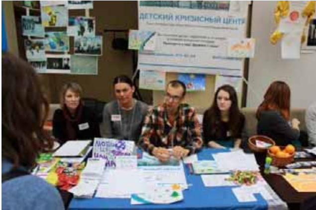
I “nostri” alla Fiera del volontariato

Il movimento del volontariato, in Russia, sta sempre più prendendo piede: è un dato di fatto!