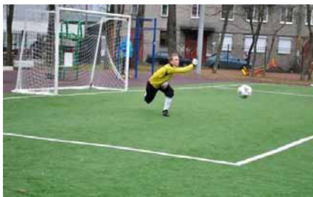
Il portiere dei "Fratelli"

Dopo l'inaugurazione ufficiale del Torneo, infatti, nonostante la pioggia ed il freddo, si sono svolte le prime due partite.