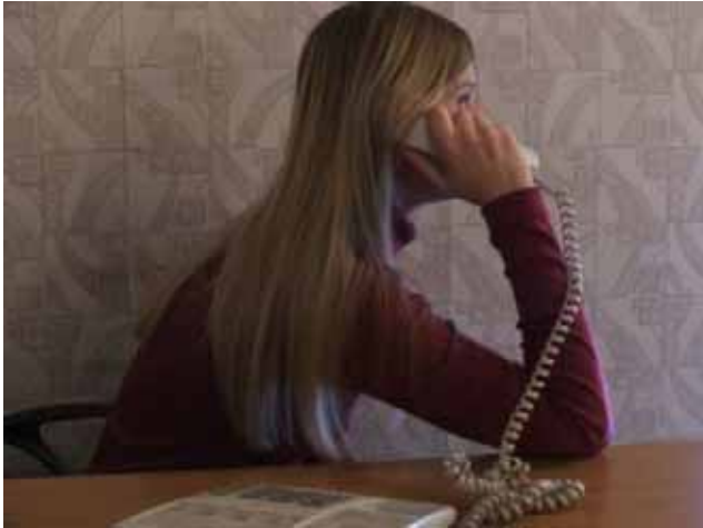
Una nostra operatrice al “Telefono di fiducia”

Sono mediamente diciassette le chiamate che nel corso delle ventiquattro ore giungono al nostro “Telefono” ed esse riguardano, più o meno, questi temi: relazioni interpersonali, relazioni tra genitori e figli, tentativi di suicidio, dipendenze (droga, alcol, computer, gioco), malattie, violenze (fisiche e sessuali), solitudine.