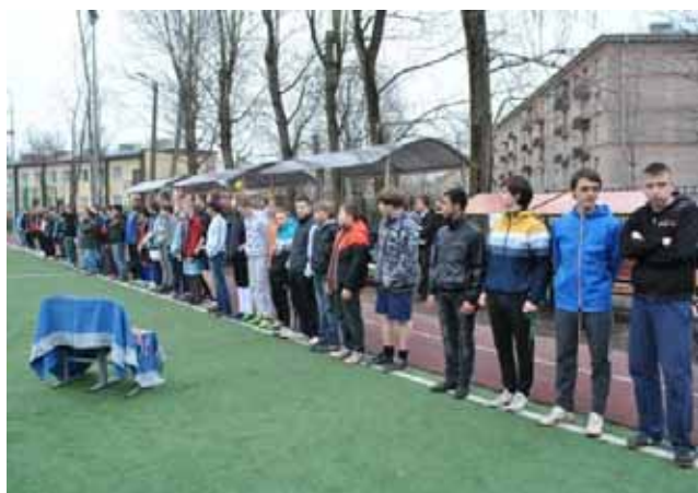
Le squadre partecipanti schierate

Le squadre partecipanti a questa edizione primaverile sono otto ed il torneo vede, dunque, il coinvolgimento di circa una settantina di ragazzi. Tra esse anche i "Fratelli": la squadra del nostro "Centro diurno" che ha esordito già con un buon pareggio nella giornata iniziale.