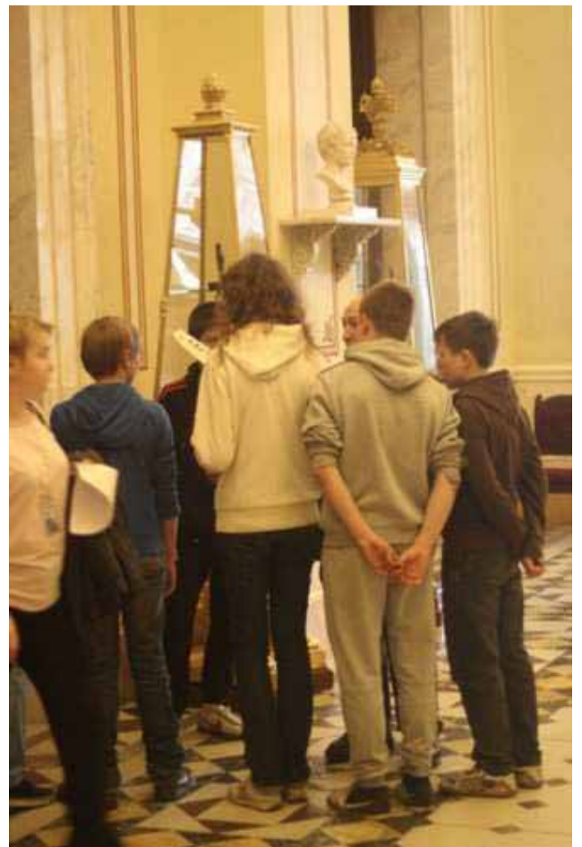
Si studia la mappa

Poi è stata fornita ad ogni capitano di ogni squadra una carta del Museo: ricordo che l'Ermitage è composto da ben venticinque chilometri di sale!