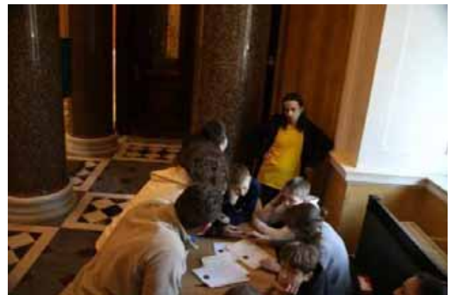
La consegna dei diplomi

Insomma, una bel pomeriggio in cui si è giocato con la cultura e l'arte e, direi: niente male per ragazzi che come arte amano, al massimo, i graffiti ed i murali!