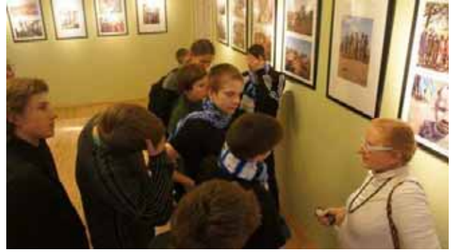
Al Museo Etnografico

Ed in questo modo ... è rimasta impressa anche qualche nozione, oltre che la vernice, su questo argomento nelle teste dei ragazzi!