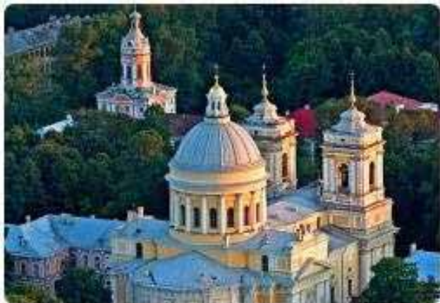
Monastero Aleksander Nevskij

Si insediò tra le mura anche il Seminario e l'Accademia teologica e nel 1742, con l'erezione della Diocesi ortodossa di San Pietroburgo, essa trovò ivi la sede.