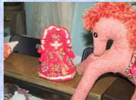
Alcuni dei lavori esposti dai nostri ragazzi