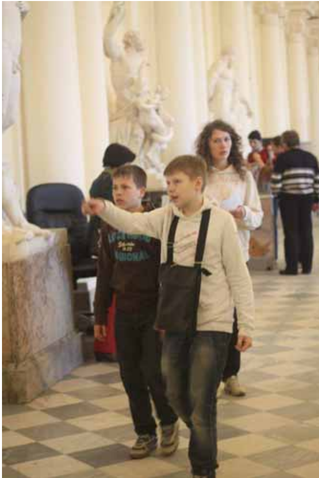
Si cerca ... l'opera d'arte!

Partiti, si sono dispersi per le varie sale, raggiunte dai vari corridoi e scale, su e giù per il Palazzo d'Inverno: sotto gli sguardi incuriositi dei turisti provenienti da tutto il mondo!