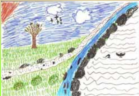
I bambini in ospedale disegnano la "primavera"