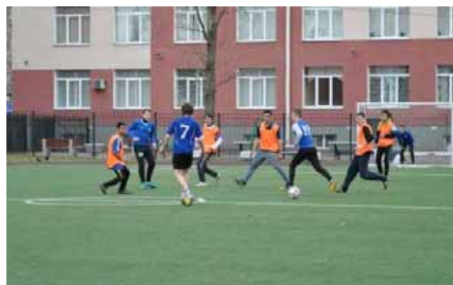
Momenti di gioco della prima partita