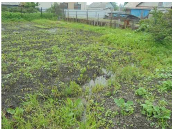
Il passaggio del ciclone: l'allagamento dell'orto e la crescita delle erbacce

Rivestitici di coraggio (!), noi invece, siamo andati a constatare, un paio di giorni dopo, le conseguenze del ciclone nel nostro orto: purtroppo tutto era sott'acqua.