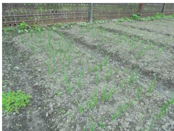
Crescono le cipolle

Ora, però, speriamo davvero che il tempo atmosferico finalmente si ristabilisca: ed allora ci renderà felici anche il raccolto di tutti gli altri ortaggi che, per adesso, nonostante