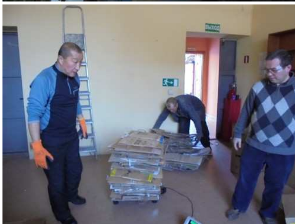
Il nostro contributo alla causa ecologica

Ma nel mondo, vi sono ormai molte esperienze, ed assai positive, in molte città, di organizzazioni che hanno reinserito nel settore lavorativo persone “senza dimora” o “marginali” proprio impegnandosi in questo campo.