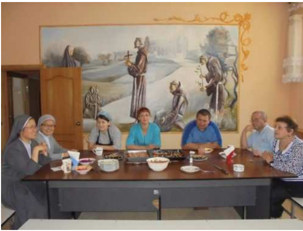
Si festeggiano le suore