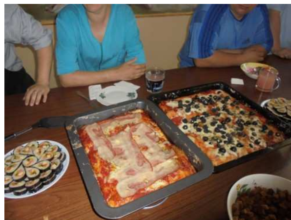
Il sapere e i sapori nel mondo

Con gli operatori del "Centro Tau", dunque, abbiamo pranzato con loro: un fraticello ha preparato per esse due buone pizze e loro stesse hanno preparato il "Kimbab", piatto tipico coreano a base di riso e verdure.