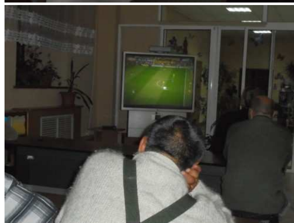
Si tifa di notte!

E, mentre mi arrivavano i complimenti un po’ da ogni dove per il buon Campionato fino a quel momento disputato, noi al “Centro Tau” di Ussurijsk si è restati in attesa della partita proprio con la Germania, della notte del tre di luglio!