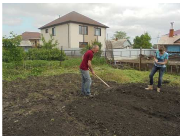
Si lavora nell'orto

Ma nel mese di giugno, qualche cosa siamo già, nonostante tutto, riusciti a raccogliere,