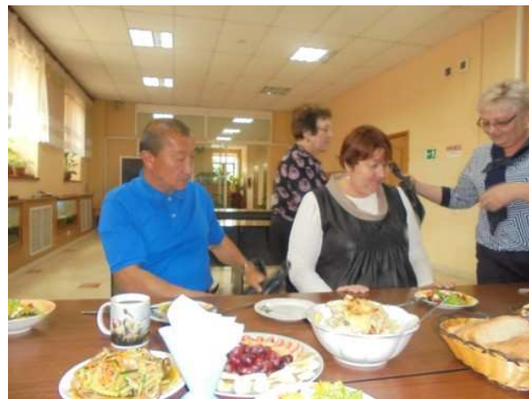
Si festeggiano gli operatori del “Centro Tau”

Ad ognuno è stato offerto un piccolo omaggio come segno di riconoscenza per il proprio lavoro svolto a favore dell’uomo in difficoltà che bussa quotidianamente alla nostra porta.