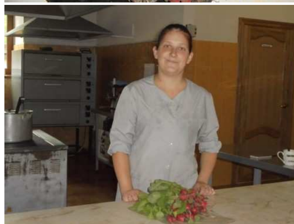
Si portano i ravanelli in cucina