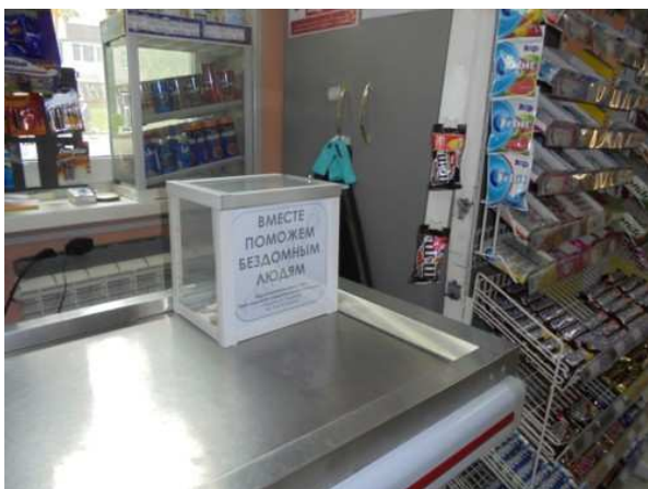
La cassetta nel negozio di alimentari ad Ussurijsk

Tale iniziativa del "Salvadanaio per il "Centro tau" di Ussurijsk" ha preso avvio un paio di anni fa.