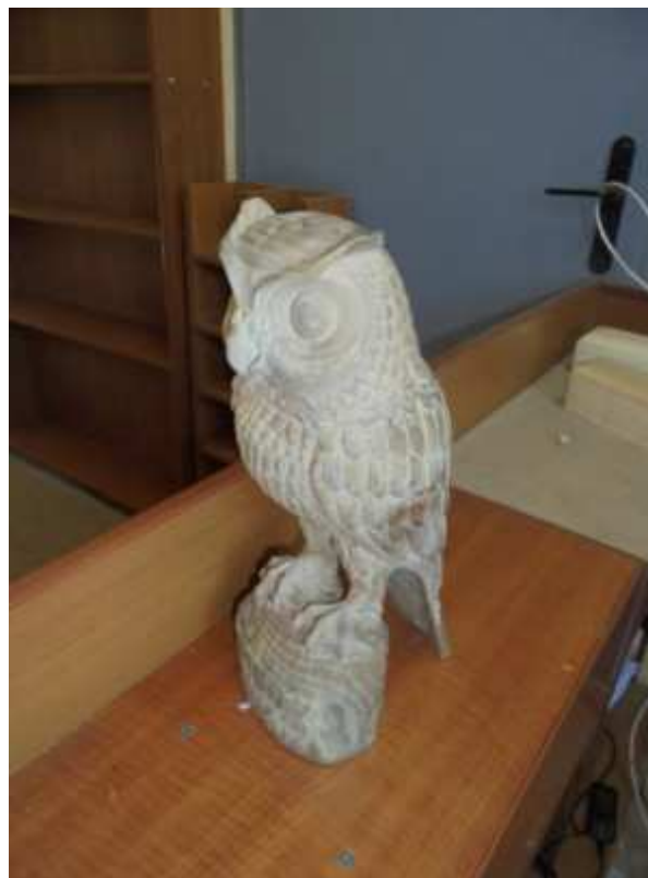
La civetta iniziata e non terminata. Per ora!

all’astinenza e se ne sono andati lasciando il “Centro Tau” alla fine di maggio. Entrambi: recidivi, ormai più volte!