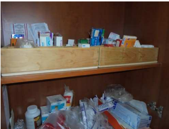
Il gabinetto medico del "Centro Tau"

Si cerca in tal modo, quindi, non solo di salvaguardare la salute dei nostri ospiti, ma anche di far loro comprendere l'importanza della cura di se stessi dopo il più o meno lungo periodo di tempo passato senza una dimora in cui essi si sono, come suol dirsi, lasciati andare.