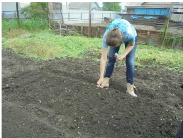
Si semina e si mettono a dimora le piantine di peperoni, melanzane e pomodori

Infatti, a partire dal giorno quattordici, abbiamo raccolto per tre volte dei bellissimi ravanelli oltre che l'erba cipollina: il tutto è sempre finito in una insalata sulla tavola del "Centro Tau".