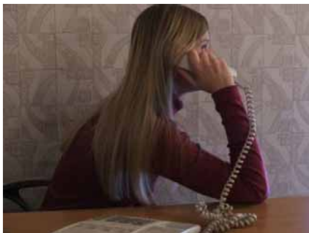
Una nostra operatrice al "Telefono di fiducia"

Che altro dire, oltre all'impressione generata da queste ultime cifre?