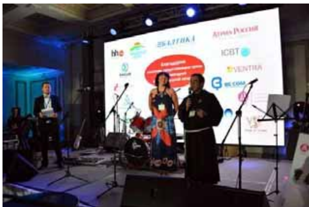
L'intervento dei responsabili del "Centro di crisi per bambini"