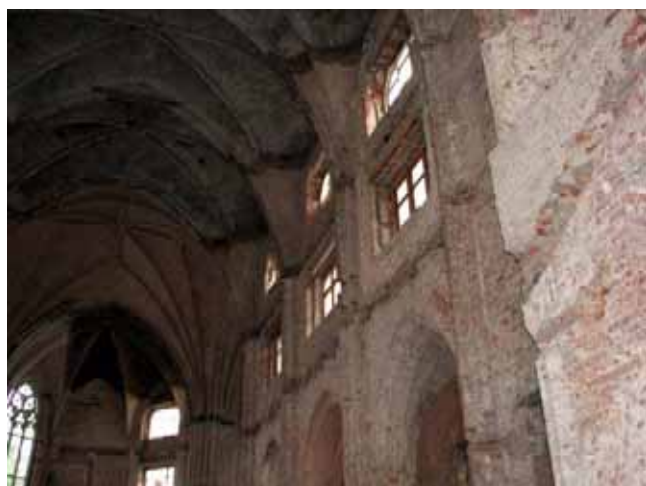
Parte laterale interna da completare

La nostra chiesa parrocchiale del Sacro Cuore è chiusa ai fedeli ormai da quasi tre anni ed è, dunque, praticamente un cantiere.