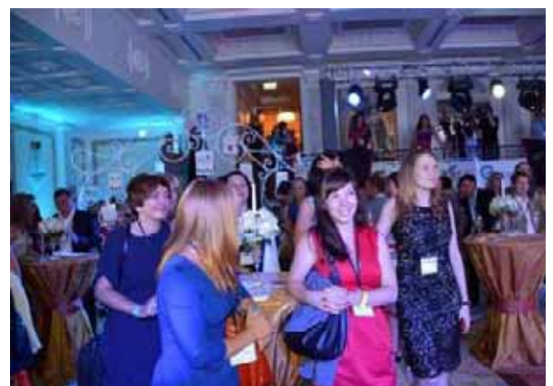
Momenti della festa di “Capodanno al contrario”