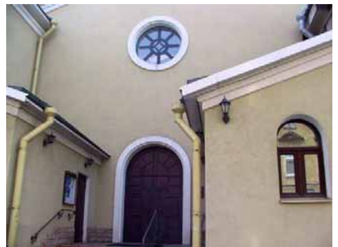
La Cappella di Sant'Antonio da Padova