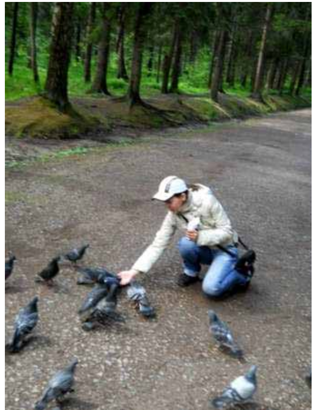
Tra i piccioni di Gatchina

Inoltre hanno passeggiato lungo i viali dei parchi incontrando scoiattoli e ... piccioni!