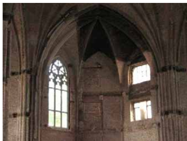
L'interno del Sacro Cuore in ristrutturazione

La nostra chiesa parrocchiale del Sacro Cuore è chiusa ai fedeli ormai da quasi tre anni ed è, dunque, praticamente un cantiere.