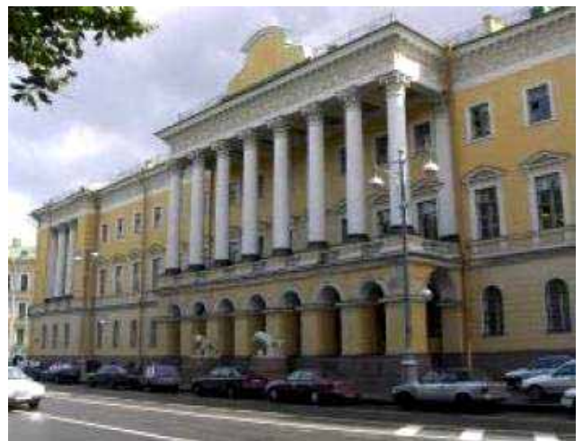
La “Casa con i leoni”

Ovviamente, presto, i nuovi “inquilini” si accorsero che una casa costruita da un privato per le proprie necessità non poteva essere adeguata per un Ministero dell’Impero e così l’architetto Anert apportò le modifiche necessarie al nuovo padrone di casa.