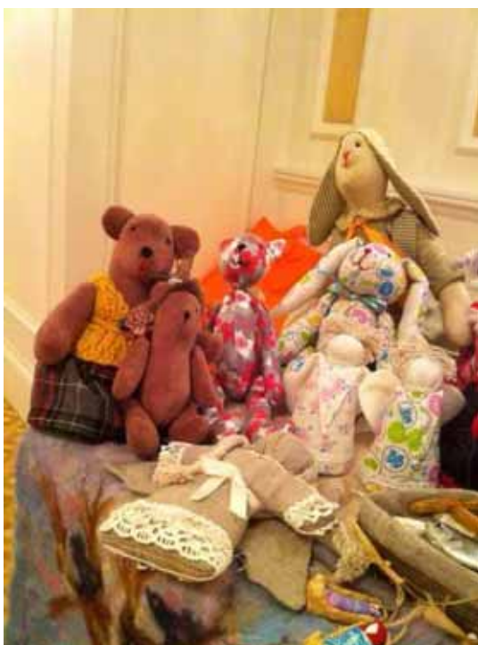
L'esposizione dei lavori dei nostri ragazzi