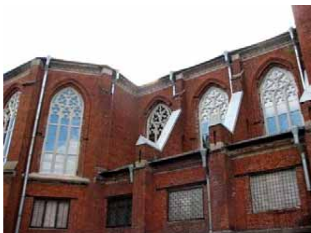
Il lato con i nuovi finestroni gotici

Qualche permesso ... alla fin fine è arrivato! E gli operai hanno avviato i lavori. Si tratta dei lavori nella nostra parrocchia del Sacro Cuore. Dopo aver realizzato e postato in primavera i bellissimi finestroni gotici sulla facciata centrale e su una laterale (ne manca ancora una!), sono giunti i permessi, attesi da moltissimo tempo, per realizzare l'impermeabilizzazione delle fondamenta ed il suo rinforzamento.