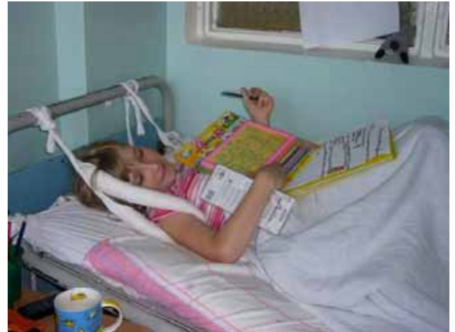
Bambini in ospedale e loro disegni