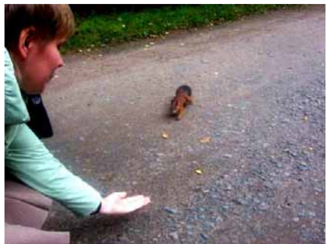
Lo scoiattolo coraggioso