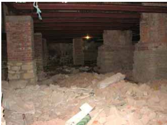
Il recupero delle fondamenta

Ed ora, finalmente, sono arrivati i permessi per l'isolamento idrico.