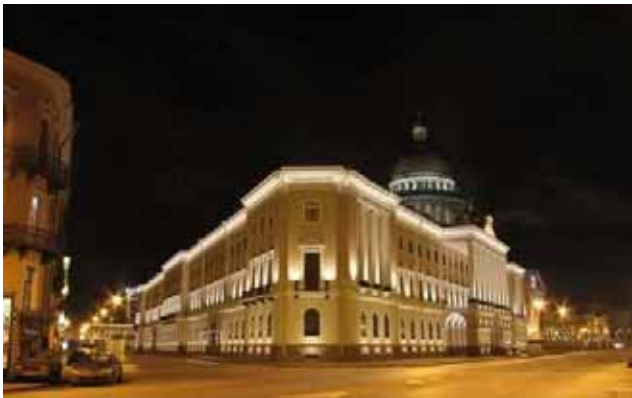
La “Casa con i leoni” e la cupola della cattedrale di S. Isacco

E la festa anticipata di “Capodanno” è stata, dunque, una delle prime grandi iniziative che si sono svolte in questo storico palazzo rinnovato e tornato all’originario splendore.