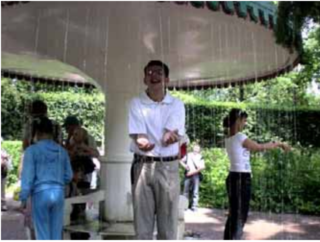
Ci si diverte nel parco