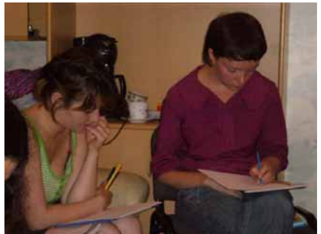
Riunione di volontari al “Centro di crisi per bambini”

Adesso, rispetto ad alcuni anni fa, sono cambiate per altro le situazioni socio-economiche e la realtà del volontariato; dunque, questo movimento ha oggi l'opportunità di svilupparsi secondo i principi ed i valori che gli sono propri; vale a dire, ad esempio, secondo il criterio della solidarietà, del servizio agli altri e dell'essere un soggetto sociale, della gratuità, del dono di sé, della continuità e della fedeltà agli impegni, dell'azione organizzata in un'associazione per il bene degli individui e della società, ecc.