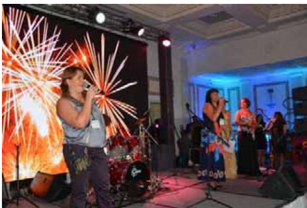
Le direttrici del club professionale "Come fare"

Quello del periodo natalizio è uno dei momenti dell’anno più propizi per ravvivare i buoni sentimenti della solidarietà e della carità.