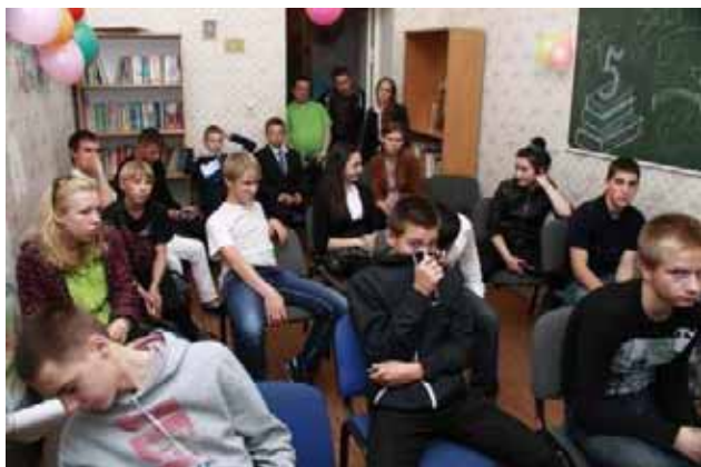
Si apre l' “Anno scolastico”

Il nuovo anno scolastico ha preso avvio in Russia: il lunedì due settembre.