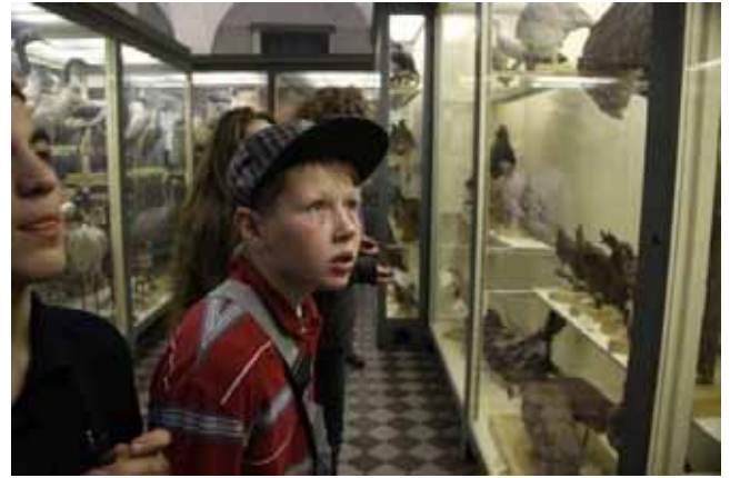
Al Museo zoologico

Nel corso di questo anno, si cercherà dunque di far visitare alcuni dei moltissimi e variegati musei che rappresentano una grande ricchezza e risorsa culturale per la città di San Pietroburgo.