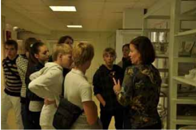
La visita alla fabbrica di porcellane

In tale occasione, i ragazzi hanno non solo potuto visitare la fabbrica ed il museo che racchiude i più preziosi pezzi creati, ma essi hanno anche potuto osservare l'intero processo della nascita di un oggetto di porcellana.