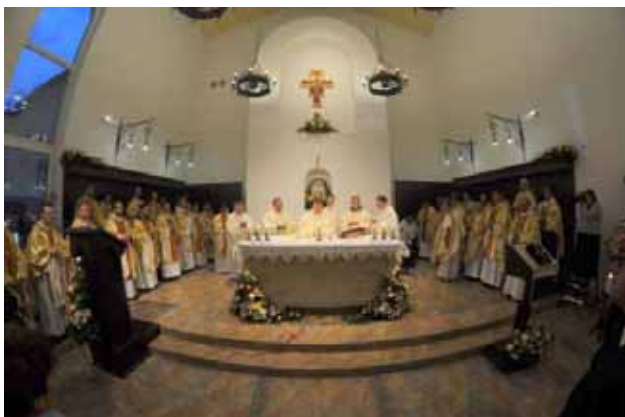
Monsignor Paolo Pezzi consacra l'Altare della Cappella di Sant'Antonio

E con la Cappella anche l'altare donato dalla Basilica del "Santo", in Padova, ai Frati Minori Conventuali di San Pietroburgo.