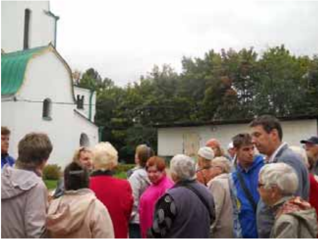
In escursione a Puskin

città e proseguire l'attività nella sede del "Laboratorio"!