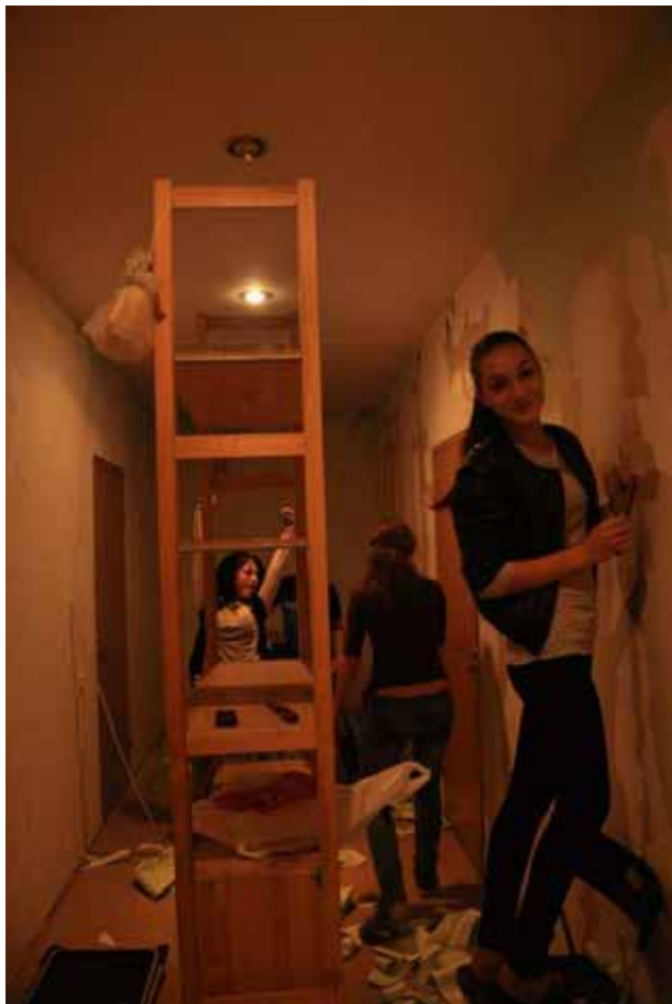
Impegnati nei lavori alla "Accoglienza notturna"

Con calma, si darà ora la tintura anche alle pareti delle stanze.