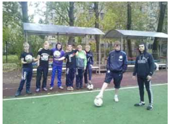
Gli allenamenti dei “Fratelli” nel mese di settembre

Sono ripresi, inoltre, anche gli allenamenti della squadra di calcio del “Centro diurno” in preparazione al torneo autunnale da noi organizzato ed a cui partecipano varie squadre di ragazzi con l'intento di prevenire il disagio sociale degli adolescenti.