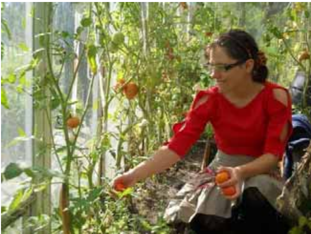
Si raccolgono gli ultimi ortaggi e frutti