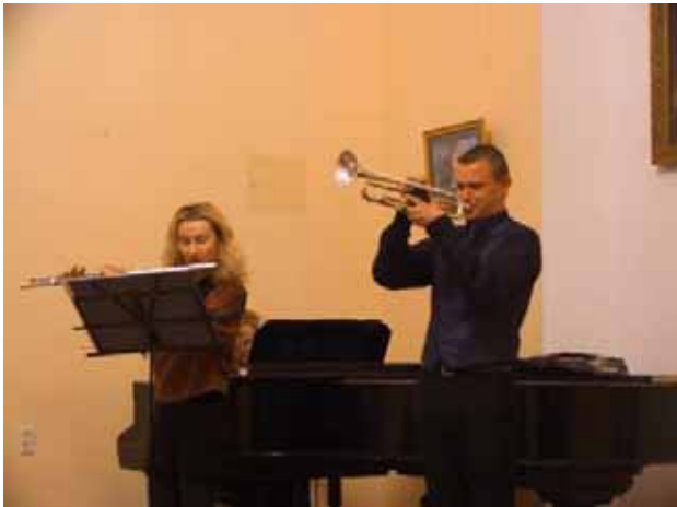
Il concerto per lo "Spazio della gioia"

Giunti a Novgorod, l'allegria compagnia dei nostri ragazzi è stata presa in consegna da una brava guida turistica che ha fatto gustare a tutti le bellezze del Cremlino, la stupenda Cattedrale di Santa Sofia con la sua unica ed irripetibile Iconostasi, il museo all'aperto delle case e chiese in legno e tanti altri importanti monumenti.