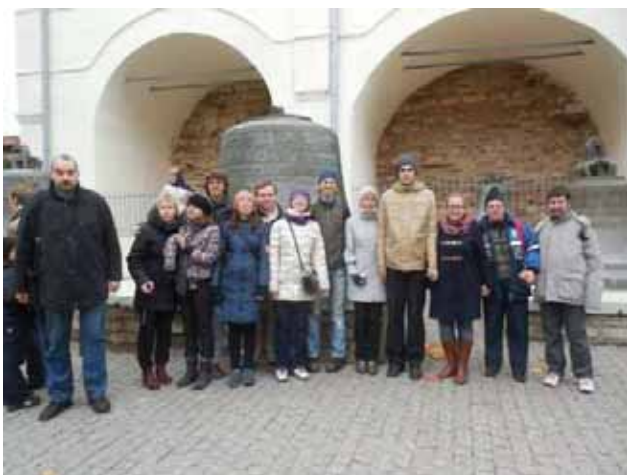
Alcuni dei nostri ragazzi a Novgorod con i volontari