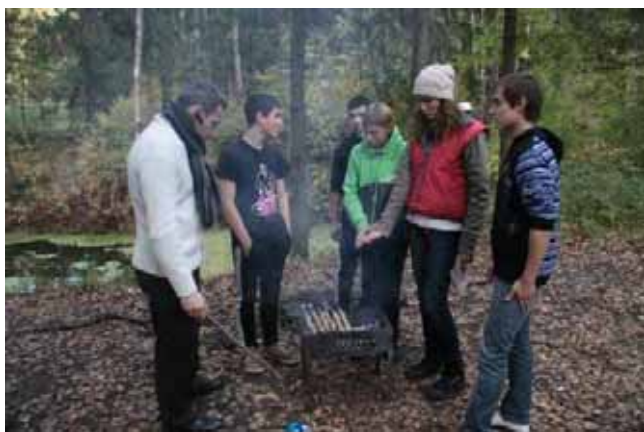
Si prepara la griglia

Tutto ciò è quanto nel mese di settembre si è vissuto con i ragazzi: e siamo solo all'inizio dell'anno!