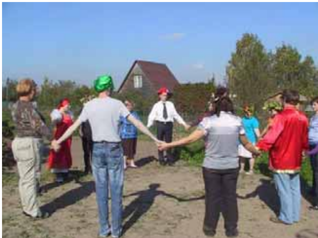
Si gioca durante la festa alla dacia

Dei quindici che sono stati alla dacia, alcuni si sono inseriti nel mondo del lavoro, e qualcun altro si è iscritto all’Istituto e frequenterà quindi la scuola superiore.