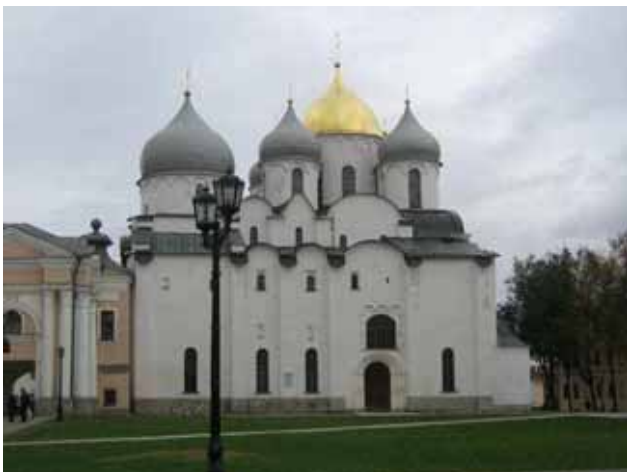
La Cattedrale di Santa Sofia