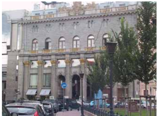
Il cinema "Rodina"