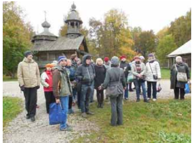
Nel museo a cielo aperto di Novgorod

Rientrati alla sera, i ragazzi erano stanchi ma assai contenti e soddisfatti di aver fatto visita a chiese e monasteri ed altri monumenti che sono gelosamente protetti dall'UNESCO come "Patrimonio dell'umanità": pronti ora a raccontare a tutti della bella e culturalmente ricca giornata, graziata anche nel tempo atmosferico, passata assieme!