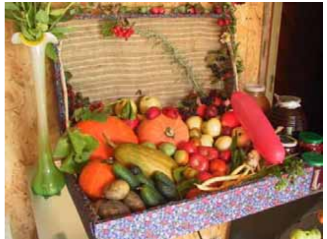
Il cesto con gli ortaggi

Nel bel mezzo di una sala della dacia, un grande cesto, a simbolo della "Festa del raccolto", conteneva alcuni dei frutti del lavoro primaverile ed estivo alla dacia: zucchine, pomodori, cetrioli, prugne e mele.