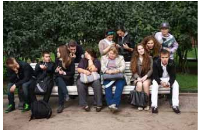
Si attende nel parco di andare al cinema

Lì, nel parco, si è anche pranzato "al sacco" sotto qualche goccia di leggera intermittente pioggia che ci ricordava come l'estate fosse ormai un ricordo.