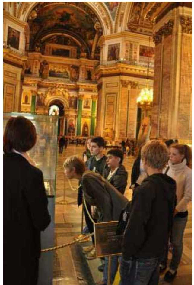
All'interno della maestosa Cattedrale di Sant'Isacco

Si è iniziato con la visita alla Cattedrale di Sant’Isacco: la bellissima Cattedrale degli Zar, in stile neoclassico, con la Cupola tra le più grandi del mondo e, dopo la chiusura dei tempi sovietici, divenuta Museo nel 1931.