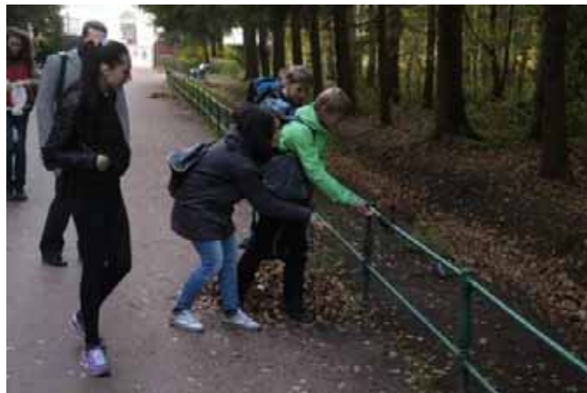
Lo scoiattolo in posa e senza paura!

Una natura che non è ancora addormentata e, così, i ragazzi hanno potuto ancora avvicinare gli scoiattoli che, per nulla impauriti, si sono lasciati avvicinare ed anche fotografare.