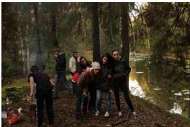
I colori del parco in autunno!