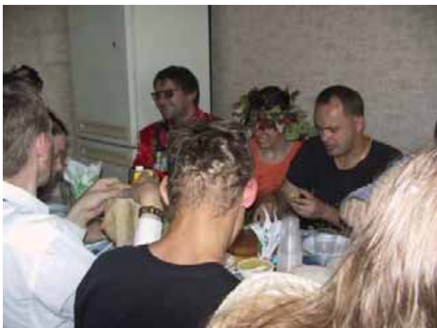
L'ultimo pranzo alla dacia